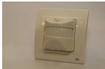
Foto 7. Detector de presencia.