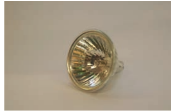
Foto 3. Lámpara halógena.

Este tipo de lámparas genera un alto consumo energético, lo que hace que no sean eficientes y eleven los costes en la factura eléctrica.