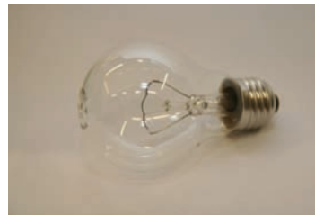
Foto 1. Lámpara incandescente.