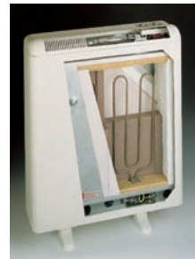
Foto 12. Acumulador de calor.