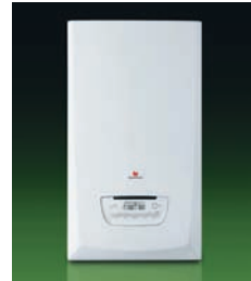
Foto 10. Caldera de condensación.