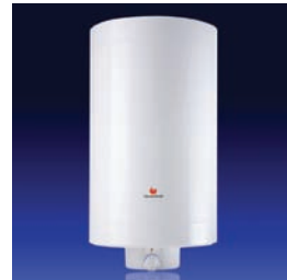
Foto 16. Termo eléctrico.