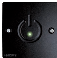
Foto 8. Pulsador temporizado.