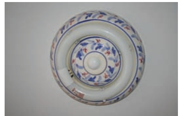
Foto 2. Tubo fluorescente convencional.