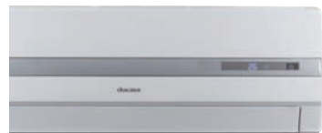
Foto 13. Bomba de calor.