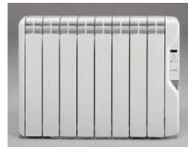
Foto 11. Emisor térmico.