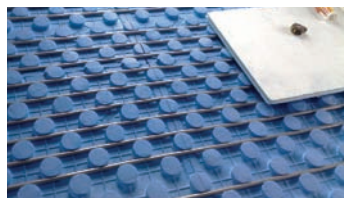
Foto 14. Suelo radiante.