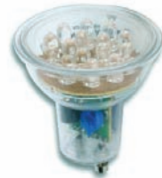
Foto 6. Lámpara Led.