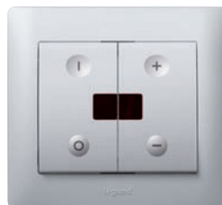
Foto 9. Regulador de iluminación.

Obviamente, el mayor ahorro energético en iluminación se obtiene apagando las luces que no se usen.