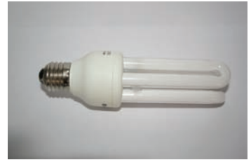
Foto 4. Lámpara de bajo consumo.