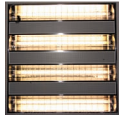
Foto 5. Tubos fluorescentes.