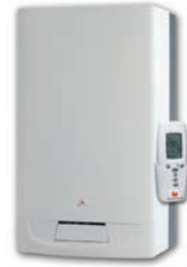
Foto 15. Caldera de condensación.